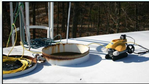
Inspection de réservoirs ou de cuves