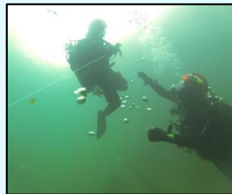
Aide à la plongée

De par sa taille, notre ROV est capable de se faufiler presque partout tout en ramenant des images de haute qualité. C'est l'outil idéal pour inspecter tous types de réservoirs ou de cuves.