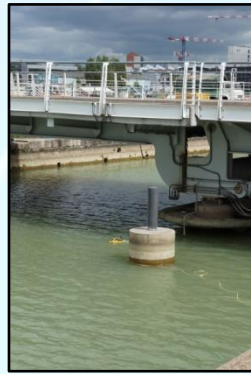
Inspection d'ouvrages immergés

Spécialisés dans les photos et vidéos en milieu difficile, nous mettons en œuvre un mini ROV moderne et agile.